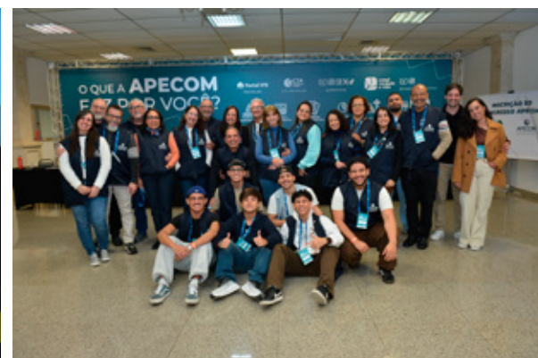
Equipe APECOM 2026