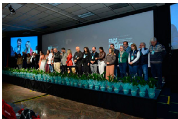
Conselheiros da APECOM e suas respectivas esposas